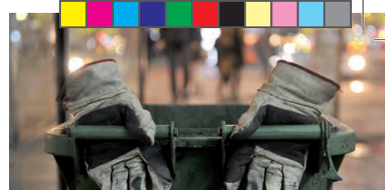
N-VA gaat voor propere gemeente p.3